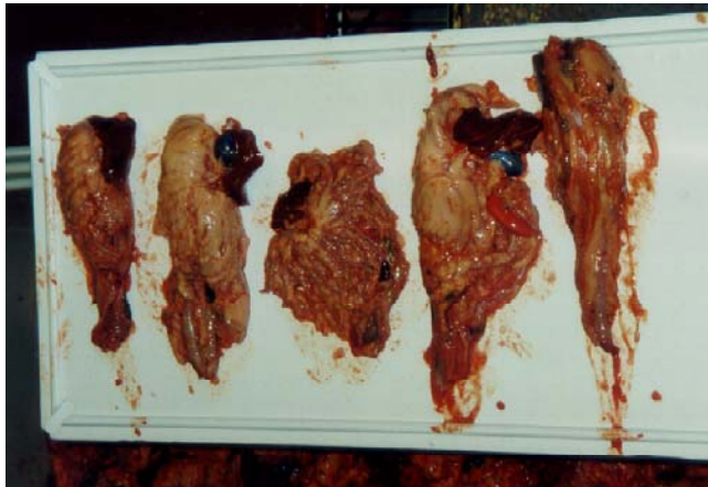
Figur 2 Sløybiprodukter fra den første utprøvingen av modifisert sløyemaskin