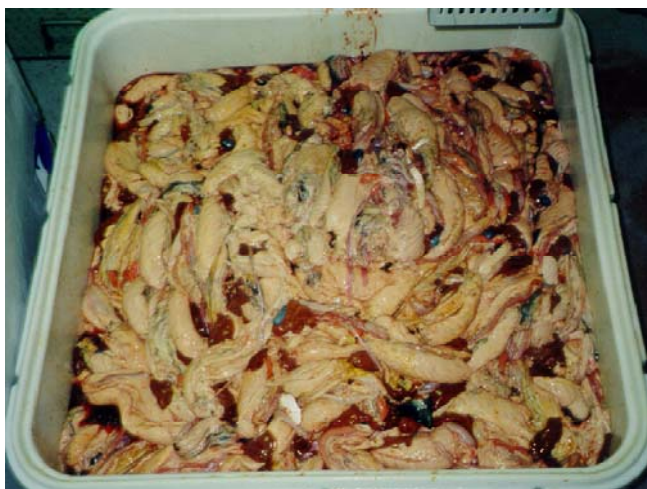
Figur 3 Sløybiprodukter fra endelig modifisert sløyemaskin