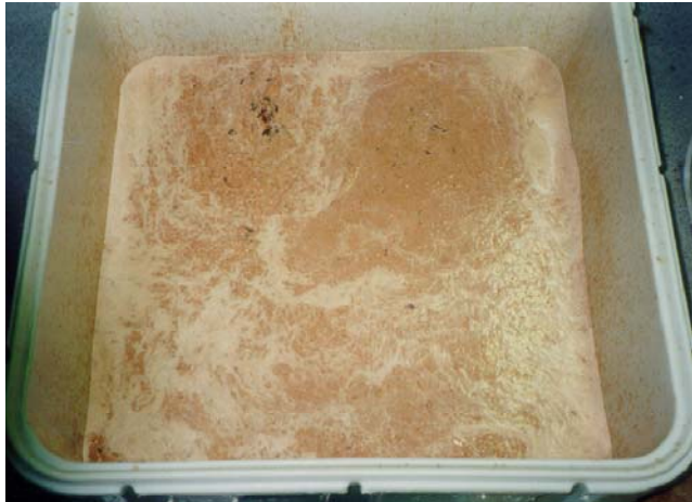
Figur 1 Sløybiprodukter med eksisterende sløyemaskin og pumping